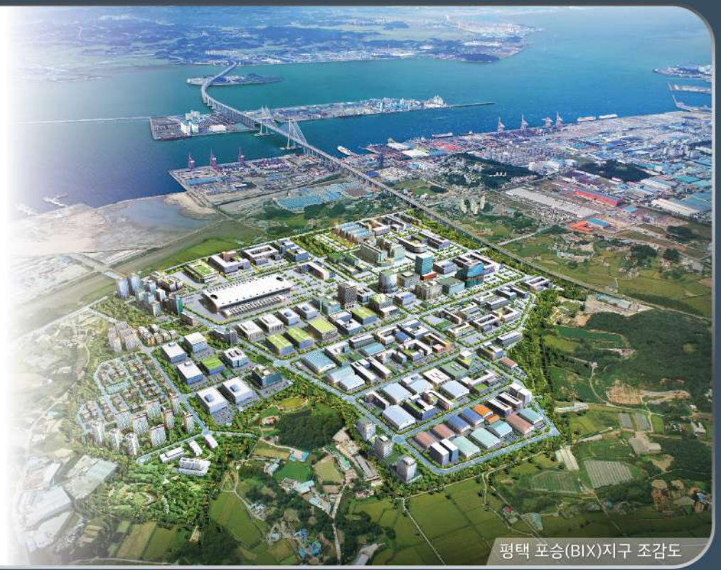
평택 포승(BIX)지구 조감도